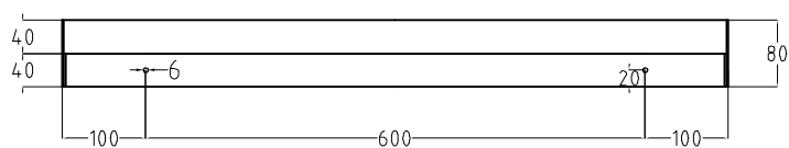
widok z tyłu rozmieszczenie otworów montażowych